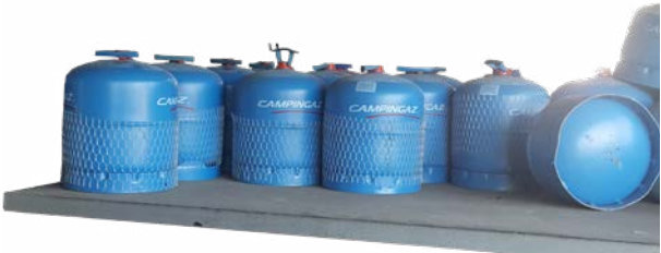
Abb. 3 Butangasflaschen