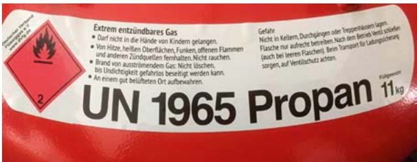
Abb. 5 Beispiel Gefahrgutaufkleber