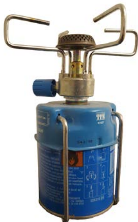
Abb. 4 Kartusche in einem Gaskocher