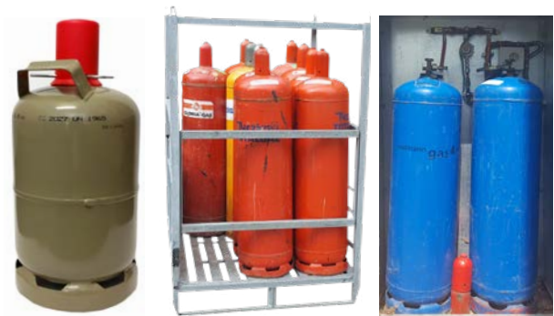
Abb. 2 Beispiele für 5-kg bzw. 33-kg-Flüssiggasflaschen