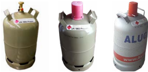
Abb. 1 11-kg-Flüssiggasflaschen unterschiedlicher Hersteller